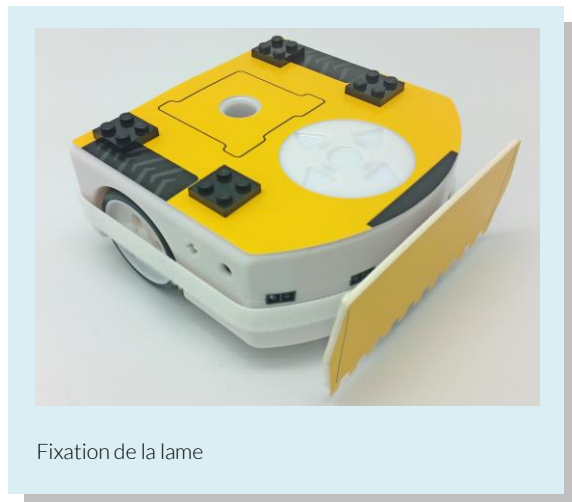
Fixation de la lame

En maintenant le bouton central appuyé pendant trois secondes (bouton rond), enclenchez le robot. Appuyez sur l'un des boutons triangulaires (n'importe lequel) jusqu'à ce qu'il n'ait plus de couleurs. Confirmez votre choix en appuyant encore une fois sur le bouton central. Le robot est prêt à être guidé avec la télécommande.