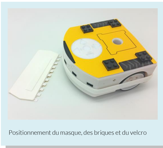
Positionnement du masque, des briques et du velcro

Posez le masque représentant le bulldozer sur le Thymio et encastrez les quatre briques LEGO® noires plates par-dessus afin de fixer le masque. Entourez le robot avec le ruban velcro et appliquez la lame sur l'avant du robot.